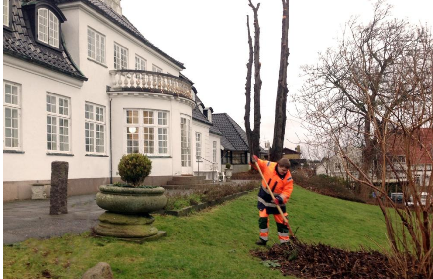
Flittige gartnere arbejder på at gøre parken forårklar.